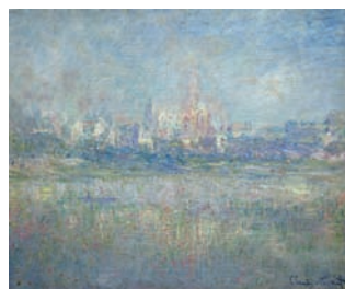
Claude Monet – Vétheuil dans le brouillard, vers 1879 – Huile sur toile, 60 x 71 cm – Paris, musée Marmottan Monet, inv. 5024