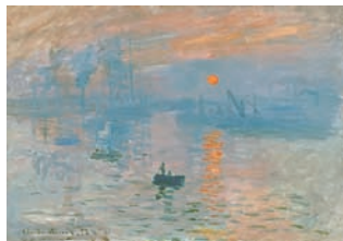
Claude Monet – Impression, soleil levant, 1873 – Huile sur toile, 48×63cm – Paris, musée Marmottan Monet, inv. 4014