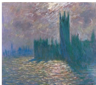
Claude Monet – Londres. Le Parlement. Reflets sur la Tamise, 1905 – Huile sur toile, 81×92cm – Paris, musée Marmottan Monet, inv. 5007