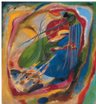
Vassily Kandinsky – Bild mit drei Flecken. N. 196 [Image avec trois taches, n° 196], 1914 – Huile sur toile, 121×111cm – Madrid, musée Thyssen-Bornemisza – ©Adagp, Paris 2010