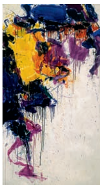
Sam Francis – Peinture , 1957 – Huile sur toile, 192,5 x 106,4 cm – Eindhoven, collection Van Abbemuseum ©Adagp, Paris 2010