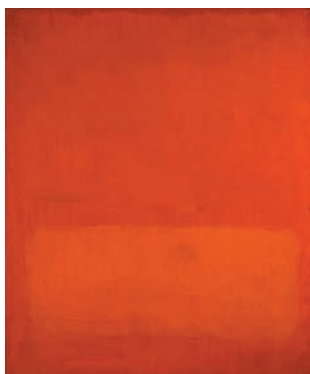
Mark Rothko – Untitled [Sans titre], 1969 – Huile sur papier et sur panneau, 121×101cm – Collection de l'université de Navarre, Fondation universitaire de Navarre – ©Kate Rothko Prizel & Christopher Rothko Adagp, Paris 2010