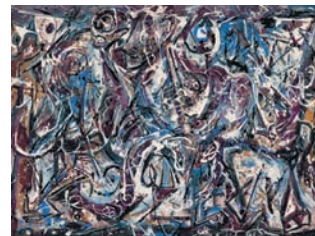
Jackson Pollock – Untitled [Sans titre], 1946 – Gouache sur papier, 56,5×78cm – Madrid, collection Thyssen-Bornemisza – ©Adagp, Paris 2010