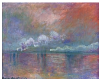
Claude Monet – Charing Cross Bridge. Fumées dans le brouillard, 1899-1901 – Huile sur toile, 73×92cm – Paris, musée Marmottan Monet, inv. 5001