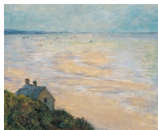
Claude Monet – La Cabane à Trouville , 1881 – Huile sur toile, 60 x 73,5 cm – Madrid, collection Carmen Thyssen-Bornemisza, en dépôt au musée Thyssen-Bornemisza