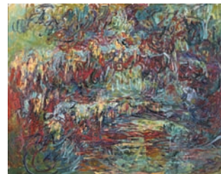
Claude Monet – Le Pont japonais, vers 1918 – Huile sur toile, 86×116cm – Paris, musée Marmottan Monet, inv. 5106