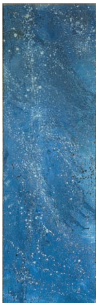
André Masson – Le Printemps s'avance , 1957 – Huile et sable sur toile, 172 x 55 cm – Paris, collection particulière