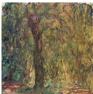
Claude Monet – Saufle pleureur , 1919 – Huile sur toile, 100 x 100 cm Paris, musée Marmottan Monet, inv. 5081