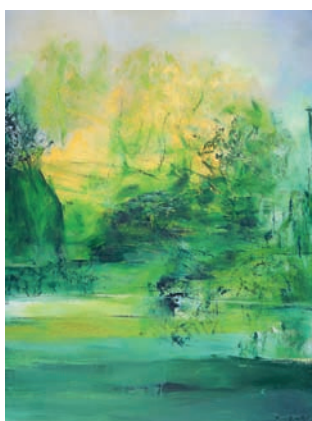
Zao Wou-Ki – Untitled (Sans titre) , 2005 – Huile sur toile, 130 x 97 cm Collection particulière – ©Adagp, Paris 2010