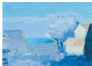
Nicolas de Staël – Paysage méditerranéen , 1953 – Huile sur toile, 33 x 46 cm – Madrid, musée Thyssen-Bornemisza – ©Adagp, Paris 2010