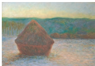
Claude Monet – La Meule, 1889-1890 – Huile sur toile, 65×100cm – Paris, musée Marmottan Monet, prêt permanent de la BogArt Collection